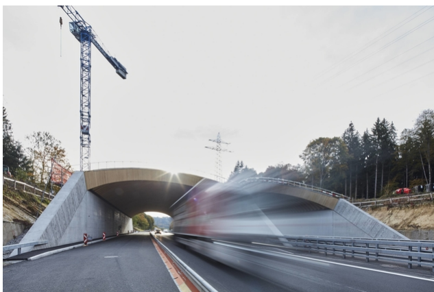
Travail de montage pendant la journée