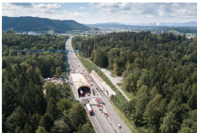
Vue aérienne pendant le montage