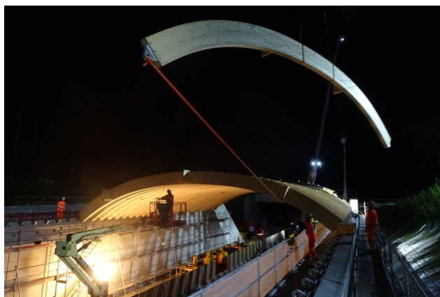
Travail de montage la nuit