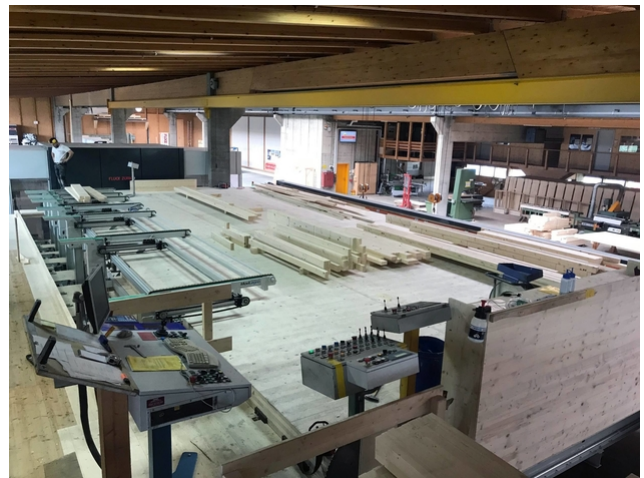
Die neue Arbeitsplattform bietet den Holzbauern sehr viel Platz