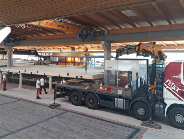
Die Plattform wird an den richtigen Ort gehievt und in der Halle aufgestellt