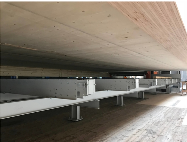
Blick auf die Konstruktion der Plattform von unten