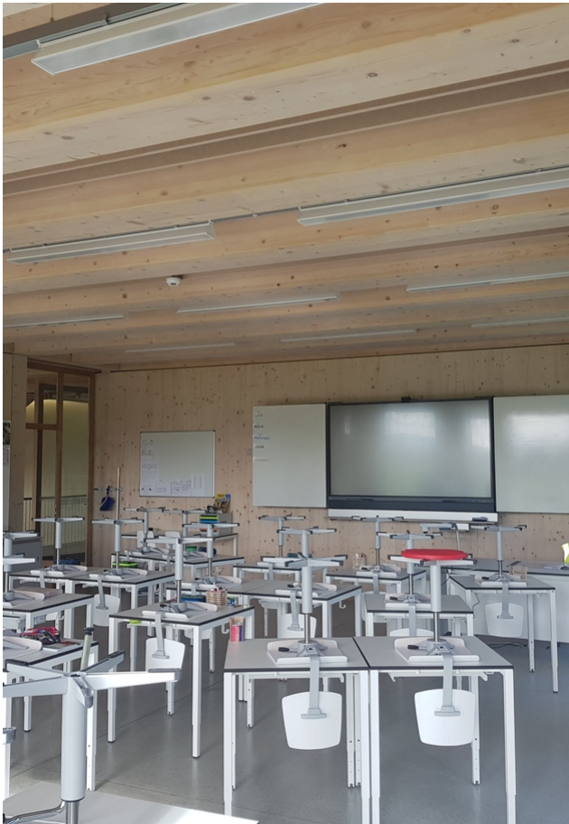
Klassenzimmer im Innenbereich.