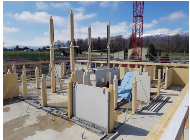
Montage des Erdgeschosses.