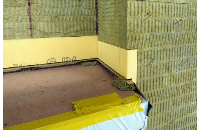
Detail Dämmung auf Fenstersims