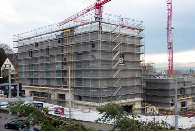
Mehrfamilienhaus mit Baustellengerüst