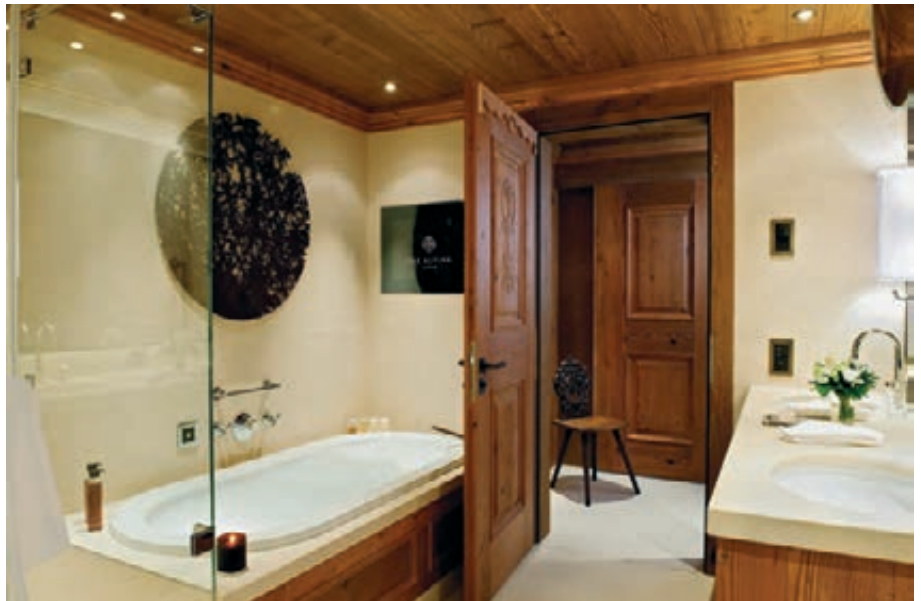
Grand Luxe Suite