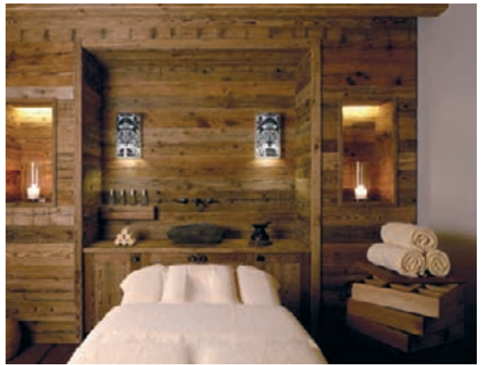
Six Sense Spa