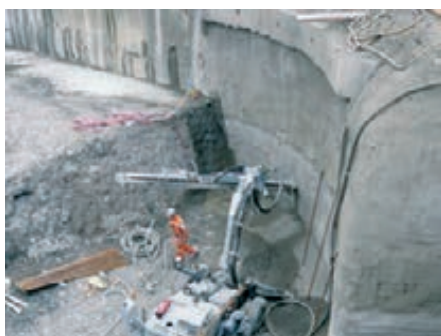
Baugrube: Ghelma AG

Mit der Chaletbau Matti AG wurde für diese Aufgaben eine renommierte Traditionsfirma beauftragt. Die Arbeit mit lokalen Hölzern wie Fichte und Tanne sowie mit aufbereitetem Altholz gehört zu den Kernkompetenzen des 1941 in Gstaad gegründeten Familienunternehmens.