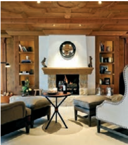
Grand Luxe Suite