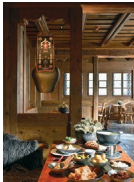
Restaurant Schweizer Stübli

um die kunstvolle Wiederverwendung von Tannenholzbrettern, die vormals jahrhundertalte Schweizer Bauernhäuser schmückten. Die Original-Elemente mit ihren kunstvollen Verzierungen und Schnitzereien werden sowohl in den Zimmern als auch in den öffentlichen Räumen eingesetzt und mit grosser Präzision mit altem Holz ergänzt. Ein Aufleben der jahrhundertalten lokalen Handwerkskunst wird hier umgesetzt. In den oberen Zimmergeschossen ist der Ausbau etwas zeitgenössischer: Mit enormem Aufwand werden aus den Sichtseiten von alten Balken Bretter geschnitten, diese gewaschen und als Basis für den Innenausbau und das Mobiliar vorbereitet. In Kombination mit alter Fassadenschalung wird der Charme der Saanenländer Chalets in das neue Interieur übertragen.