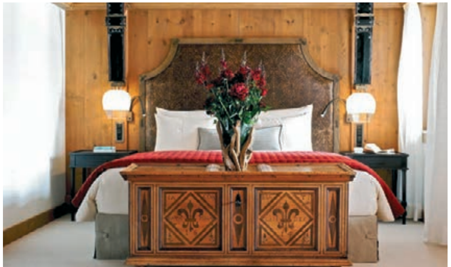
Grand Luxe Suite