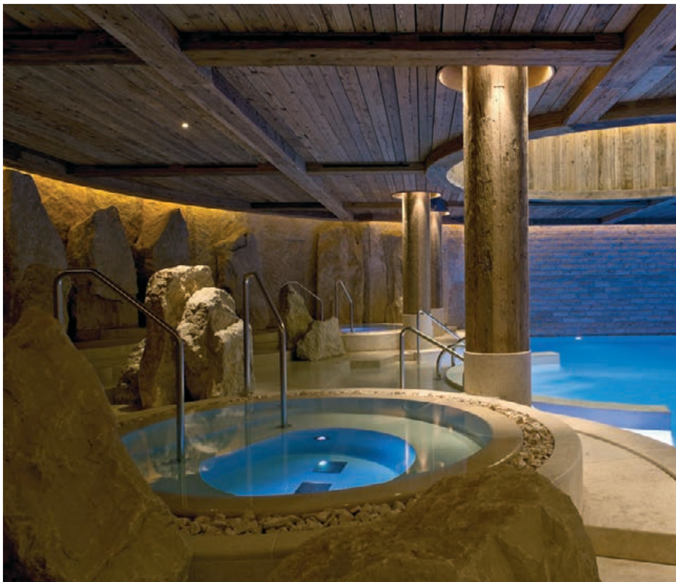
Jacuzzi im Poolbereich

Dabei bleibt der Gesamteindruck stets luftig und kontemporär - mit modernen Kaminen und einem raffinierten Zusammenspiel edler Stoffe und Texturen wie Kaschmir, Wolle und Leinen. Jede Suite ist zudem mit einem antiken bäuerlichen Schrank eingerichtet, der als Bar dient und mit modernen Annehmlichkeiten wie einem Spülbecken, Kühlschranks, Getränkekorb, Gläsern, Snacktellern und anderem mehr ausgestattet ist. Die geräumigen Kleiderschränke sind innen beleuchtet, die Schubladen mit Seide ausgepolstert.