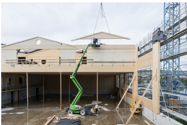
Montage d'une construction en bois : la structure de la salle de sport est en cours de montage