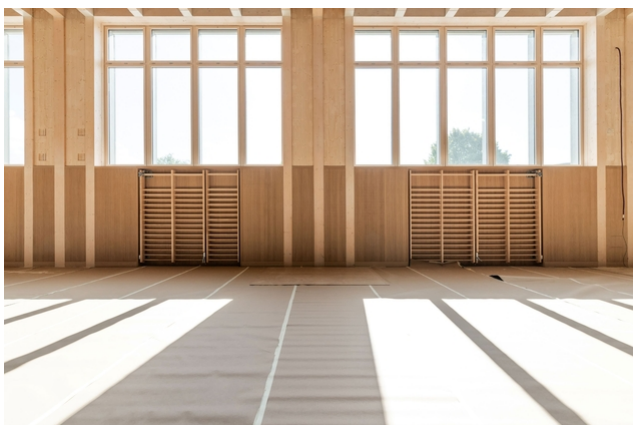
Vue intérieure du gymnase au stade du gros œuvre