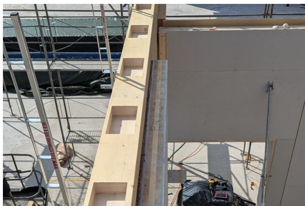
Poches fraisées destinées à recevoir les cames de cisailment de la poutre de Vierendeel