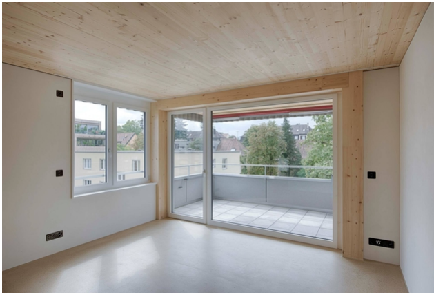
Passage vers le balcon