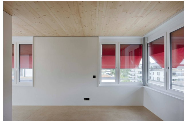
Espace de vie