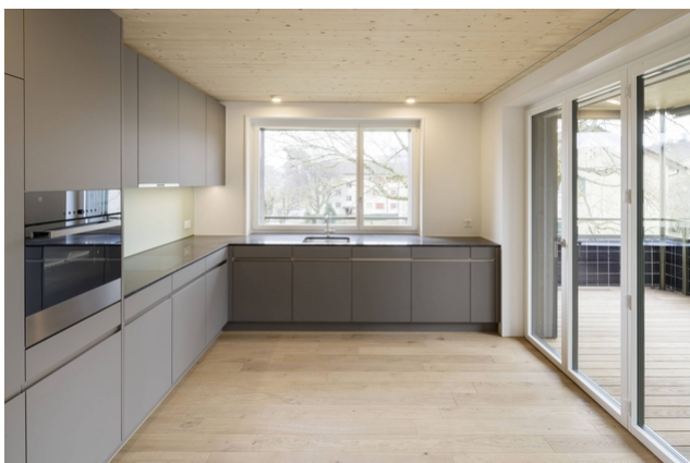
Vue de la cuisine avec plafond en bois apparent