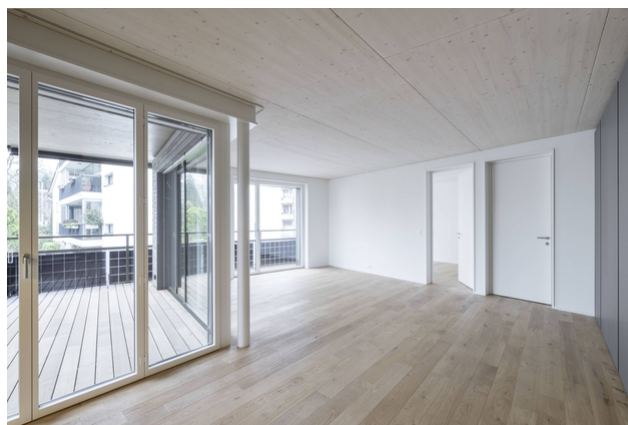
Grande terrasse avec sortie de plain-pied