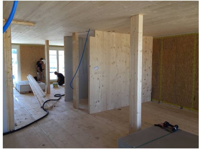
Poteaux et panneaux dans le gros œuvre