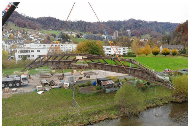
Travaux de montage sur le pont