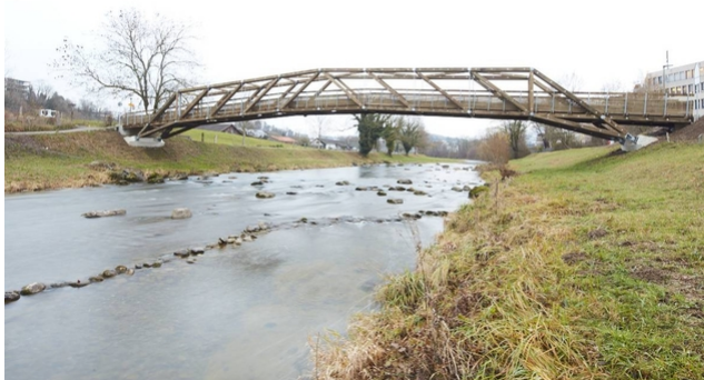
Le nouveau Tüfisteg