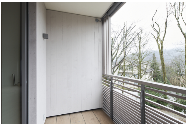
Bois sur la façade et les balcons