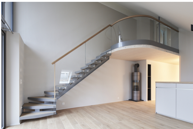
Galerie de l'appartement en duplex