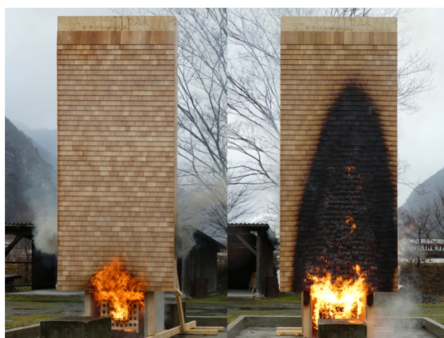
Un essai d'incendie de la façade en bardeaux