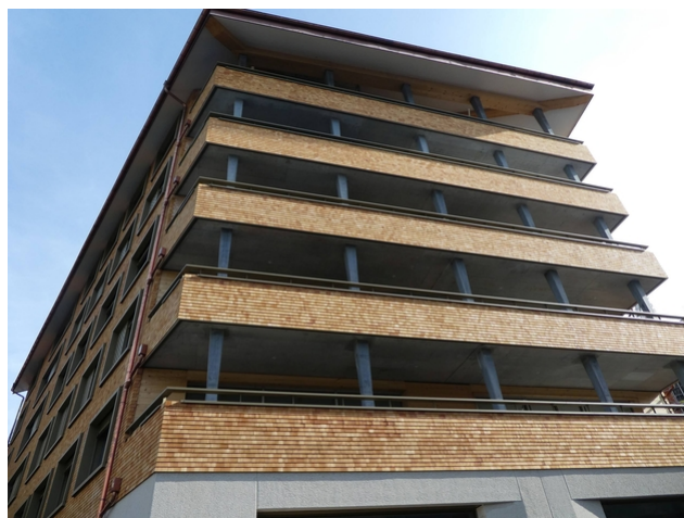
Appartementhaus Wolf : recouvert de bardeaux de bois de haut en bas