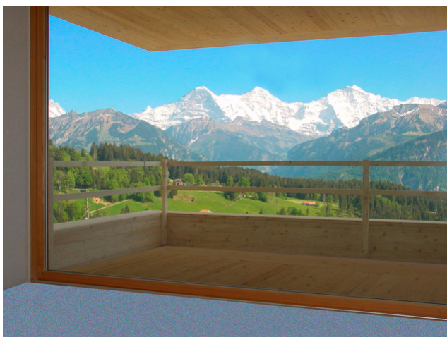
Visualisation de la vue sur l'Eiger, le Mönch et la Jungfrau depuis la loggia