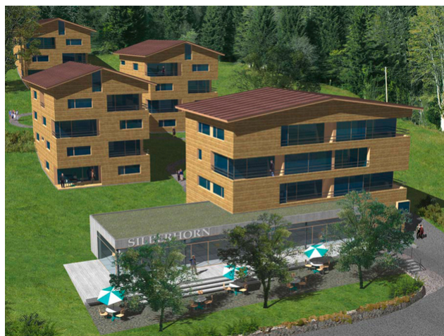
Visualisation de l'ensemble de la structure