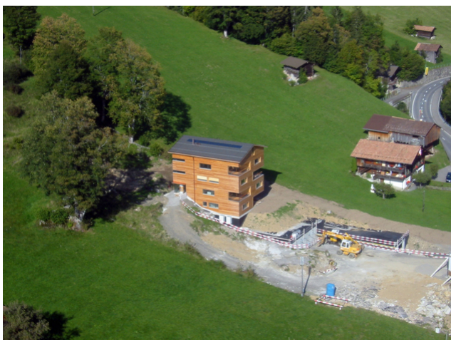
Vue aérienne d'un bâtiment