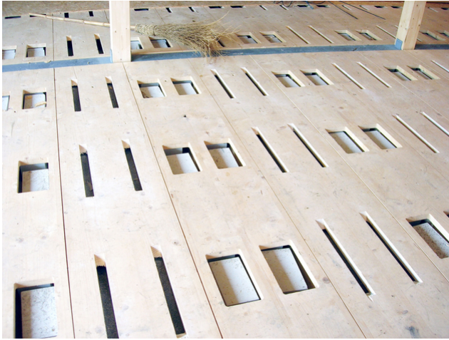
Remplir la signature d'ouverture Silence