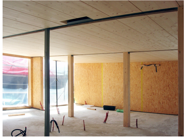
Supports en bois