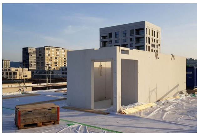
Treppenhaus in der Bauphase