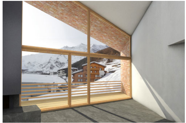
Aussicht nach Westen