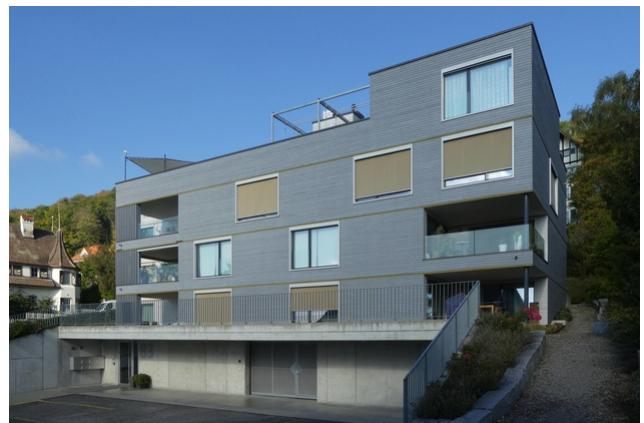
Ansicht nach 6 Jahren