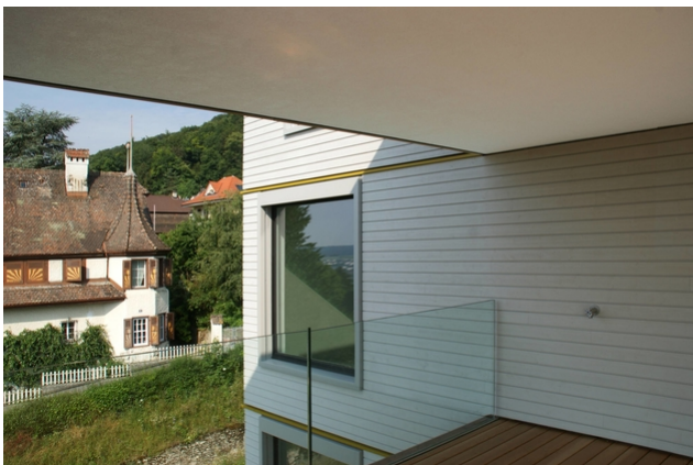
Die Terrasse

Somit erfüllt der Bau auch die hohen Anforderungen an die Ökobilanz und an den Energieverbrauch im Betrieb. Die kurzen Verkehrswege ermöglichen zusätzlich einen ökologischen Lebensstil.