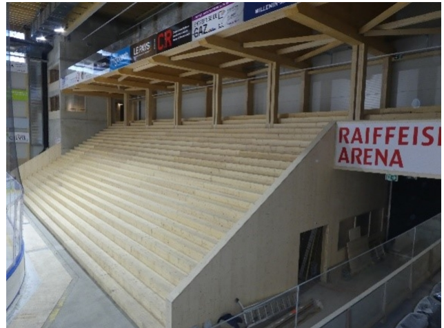
...und zu Bauprodukten verarbeitet