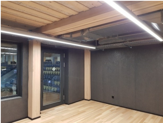
Das Holz wurde im Winter 18/19 geerntet