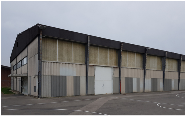
Turnhalle vor der Sanierung