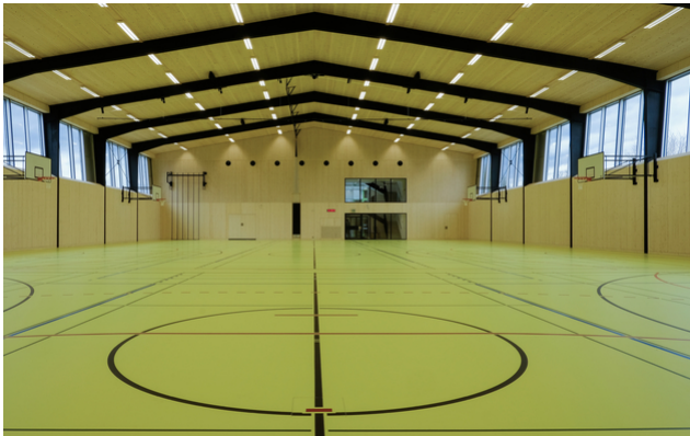
Innenansicht nach der Sanierung