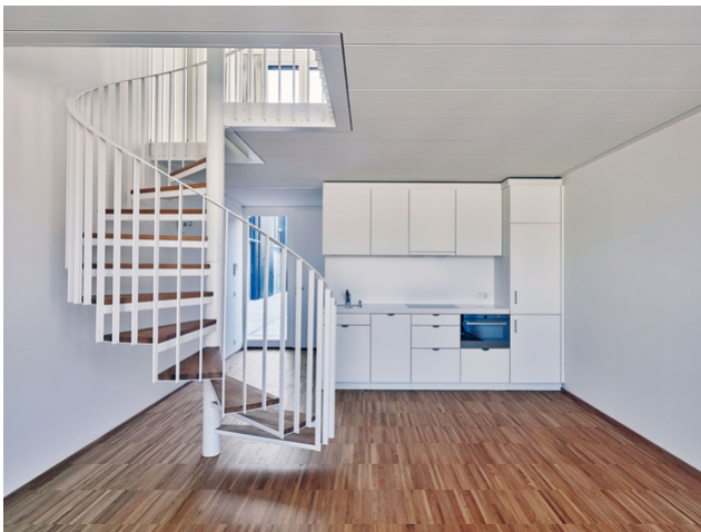
Blick in eine der zweistöckigen Wohnungen Typ MIN