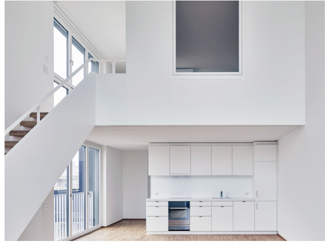
Einige der Wohnungen sind dank der Galerien extrem luftig