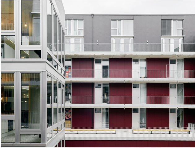
Die Apartments der MIN MAX Entwicklung sind über Arkaden erreichbar