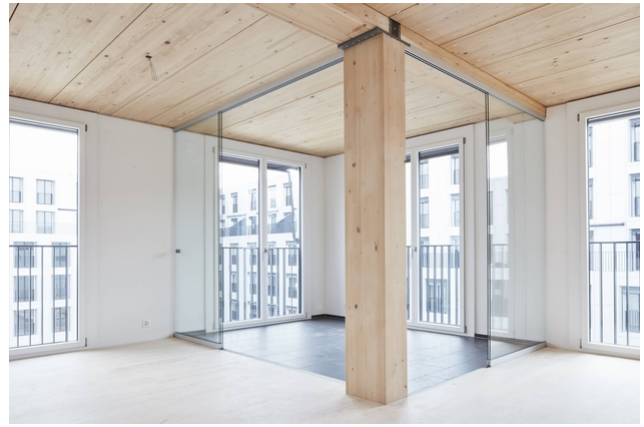
Loggia mit Stützen und Decken in Holzbauweise