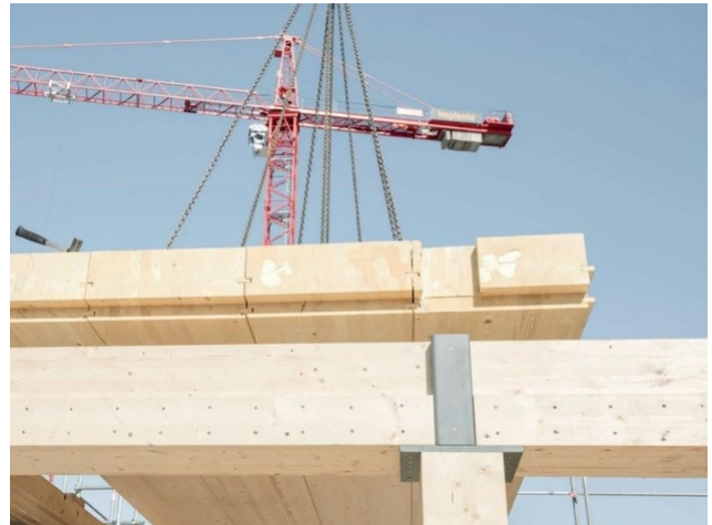
Der Knoten: Stahlteile leiten die Last von der einen Stützen zur nächste.